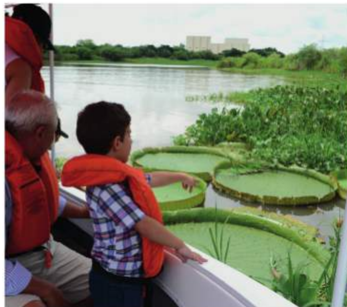
Corredor turístico de la costa santafesina