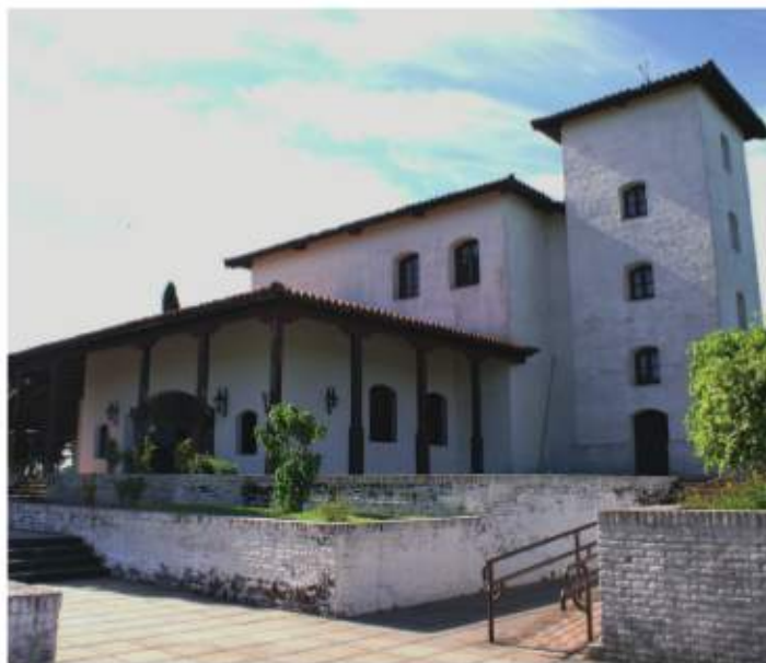
Parque Arqueológico Santa Fe La Vieja, Cayastá