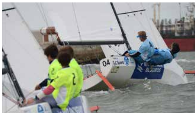
Náutica: Sail 5 Tour