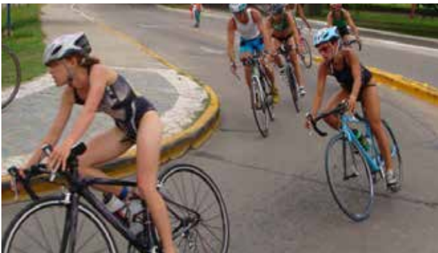
Triatlón Ciudad de Santa Fe