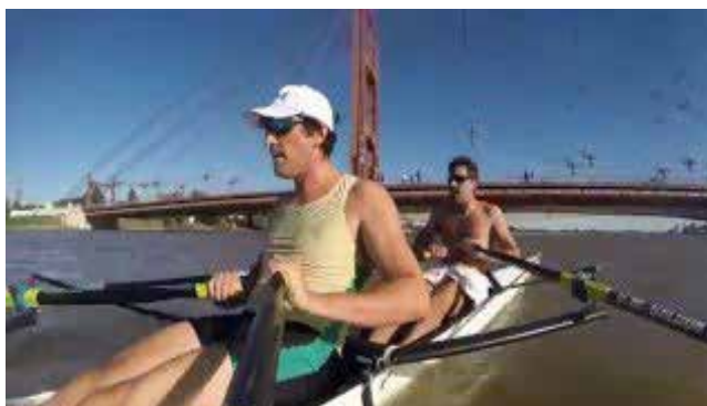
XXI Sudamericano de Clubes de REMO Máster 2016