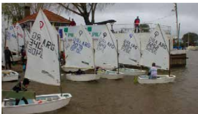
Semana de la Setúbal