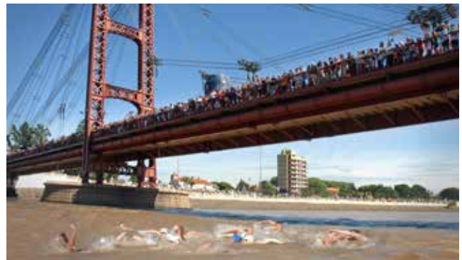
Maratón Santa Fe - Coronda